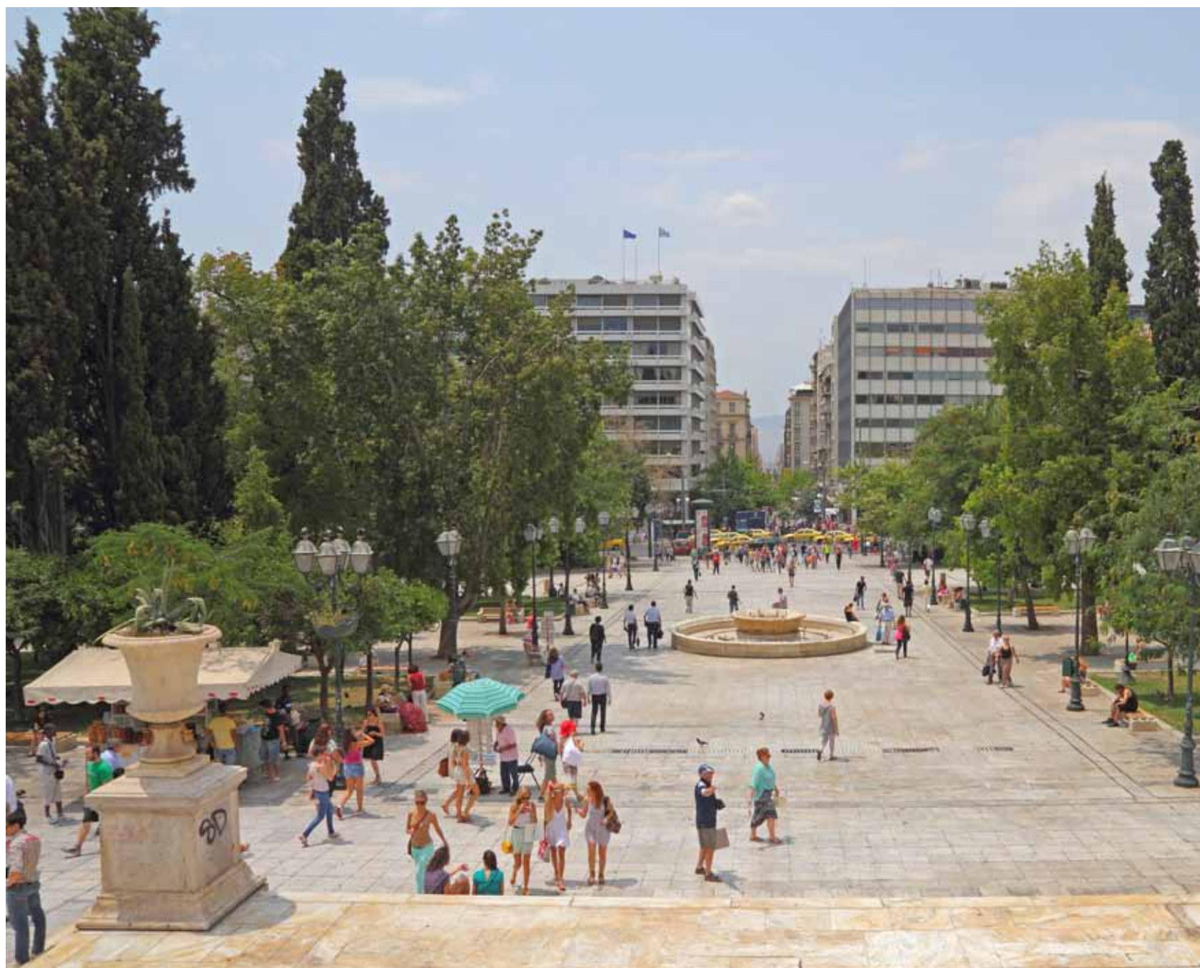
Sinds de laatste renovatie van Syntagma – vlak voor de Olympische Zomerspelen in 2004 – is het plein verfraaid met graszoden, sinaasappelbomen, cipressen, oleanders

Levendigheid en diversiteit, dat zijn de woorden die de sfeer op dit plein het beste kenschetsen. Het plein wordt gebruikt, ongeacht het tijdstip en ongeacht het seizoen. De inwoners van de stad stappen hier uit metro, tram, bus of taxi. Ze gebruiken het plein als trefpunt,