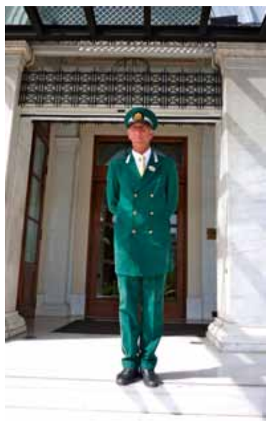
De portier van het prestigieuze Hotel Grande Bretagne en de bedelaar, twee beelden die op Syntagma zijn vertegenwoordigd.