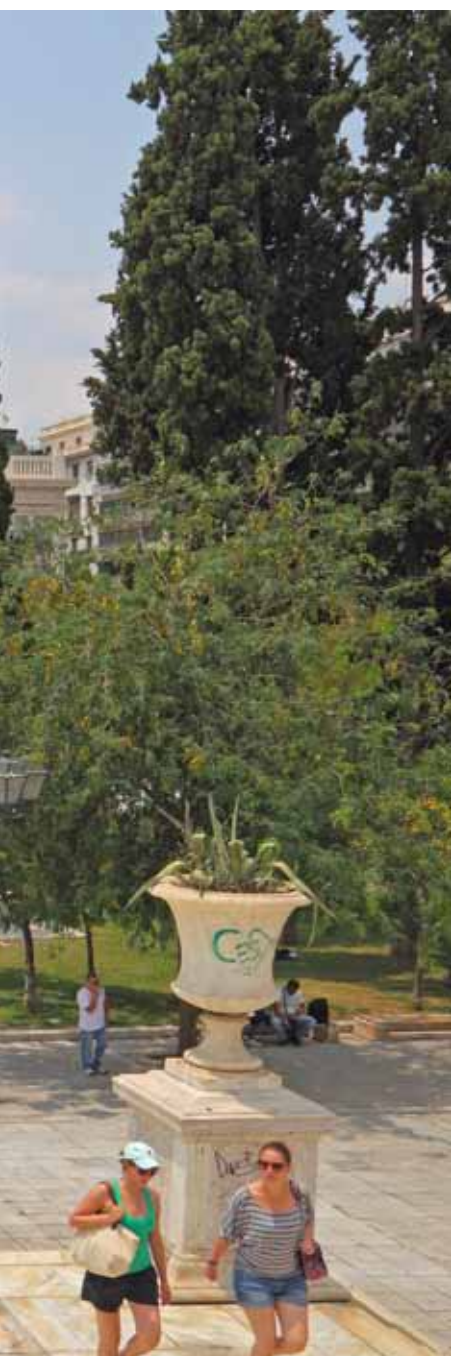
ers en allerlei stadsmeubilair.