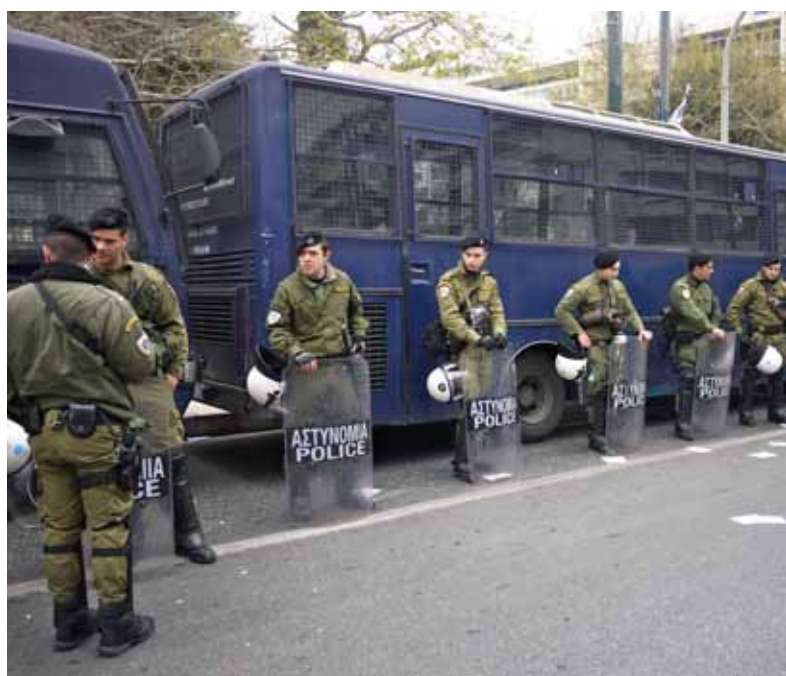
De ME maakt zich op voor de zoveelste demonstratie.

Theophil von Hansen kwamen in het kielzog van koning Otto naar Athene om dat voor elkaar te krijgen. Het zijn deze Duitsers die voor een groot deel verantwoordelijk zijn voor de neoclassicistische stijl van dit plein en veel van de omliggende gebouwen. Tot in het midden van de twintigste eeuw stond het plein vol terrasstoelen, horend bij de vele cafés en patisserieën eromheen. Hier werd decennialang onder het genot van een kop koffie, een glas water en een sigaret – in vaak verhitte discussies – de politiek besproken. Het bekendste café heette in de volksmond dan ook niet voor niets ‘de Senaat van Zacharatos’.